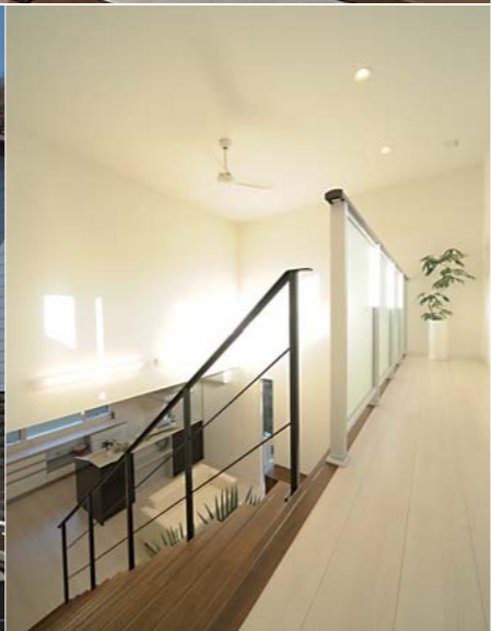
右頁／すっきりとデザインされたリビング階段。同社オリジナルの意匠が光る 左頁・上／光あふれるLDK。大きな吹き抜けから陽光が差し込み、冬でも暖かい 下左／すべてのフロアに床暖房を施している。温度差のない廊下は冬も快適 下中／直線で構成されたシャープな外観。手前のインナーガレージも同じテイストでデザイン 下右／2階ホールから階下を見る。どこにいても家族の気配を感じるレイアウトだ