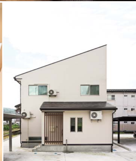
右頁 / 「おもちゃを広げばなしにしてもいいように」子どもの遊び場は中2階に。生活空間とは切り離しながらも目は届く間取りだ。また、すき間のある手すりは家族の気配だけでなく、風や快適な温度をめぐらせる。上 / リビングから少し下がったところにキッチン、その上に中2階。ユーホームズこだわりの高い気密性と断熱性で、家の中は夏も冬もエアコン一つでまかなえるという。下左 / 朝食は床に座り、このカウンターで。下中左 / 2階は吹き抜けで階下とつながる。下中右 / 2階から見下ろしたところ。下右 / 片流れの一軒家の左には魚野川、そして坂戸山がある。