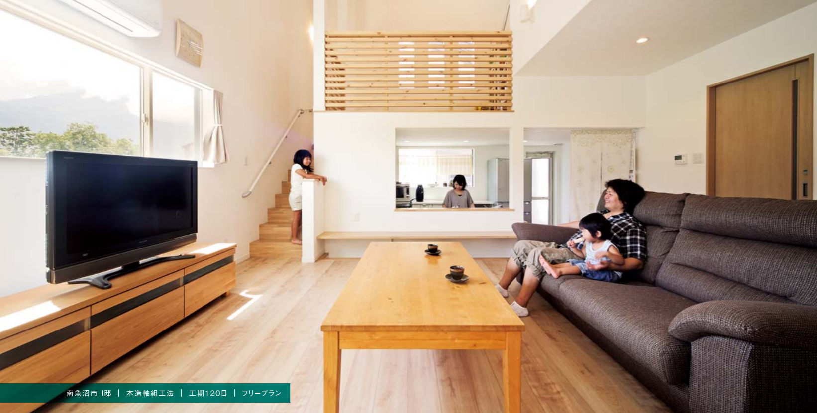
南魚沼市 I邸 | 木造軸組工法 | 工期120日 | フリープラン