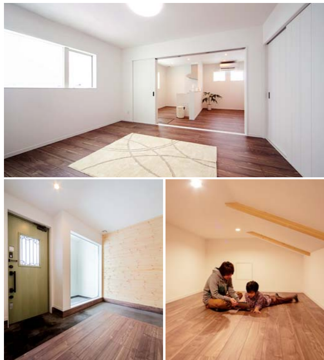
上 / 1階は親世帯の空間。ダイニングキッチンと手前のリビングは建具を開ければバリアフリーに 下左 / 広々とした玄関には大きな窓があり開放感いっぱい 下右 / 屋根裏は収納や子どもの遊び場としても使えるプラスアルファの空間