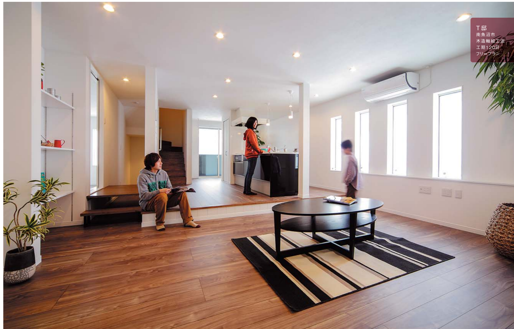
丁邸 南魚沼市 木造軸組工法 工期120日 フリープラン

白とブラウンを基調にしたシックな室内。開放感あふれる大空間での暮らしには熱損失係数を踏まえた、必要十分な性能と暮らしやすさが融け合っている。