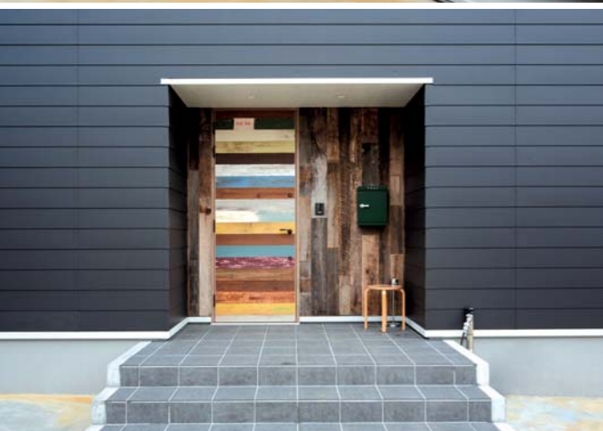
上/2階にあるリビングスペースは天井にレッドシダーを張り、正面に掃き出し窓、TVボードの左右に縦長窓を設けている 中/建物背面の外壁は木。深めの庇の下、1階と2階の両方にデッキが伸びる 下/ビンテージ仕上げの板を組み合わせた玄関周り。板のエイジング加工は地元の塗装屋に依頼した